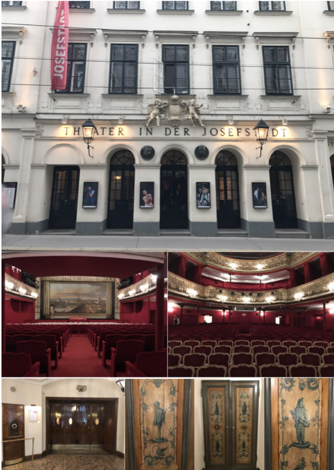
Theater in der Josefstadt (de arriba abajo e izqda. a drcha.): Fachada, escenario, aforo (620 personas sentadas), vestíbulo detalle de puertas interiores pintadas.